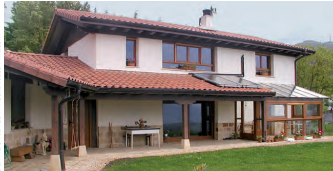
© EKAITZ URIBE RUIY NAGORE TOLOSA IRAZUSTA